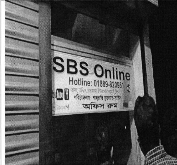
অবেধ আইএসপি সেবাদানকারীর অফিস